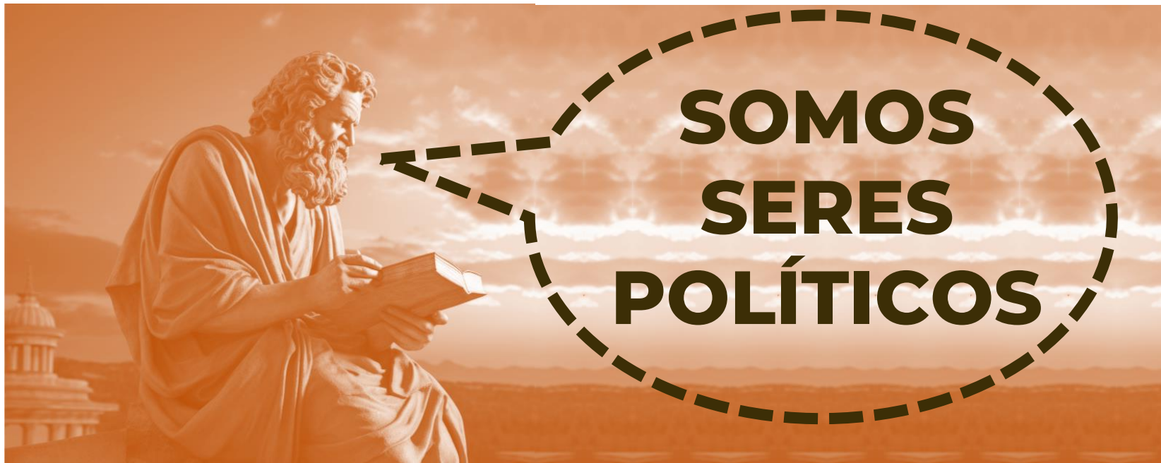
Αριστοτέλης - ARISTÓTELES (384 a.C – 322 a.C)