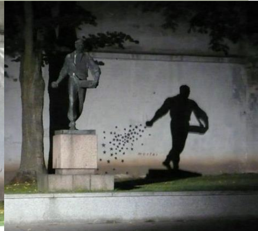
Semeador de Estrelas - Kaunas, Lituânia