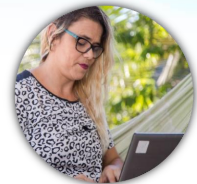
Consultoras de Beleza Natura

“Gestores em partilha para o fortalecimento da Educação Pública.”