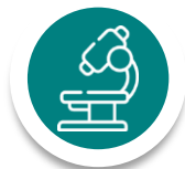
Ciências da Natureza