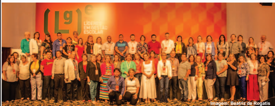
Imagem: Beatriz de Rogatis