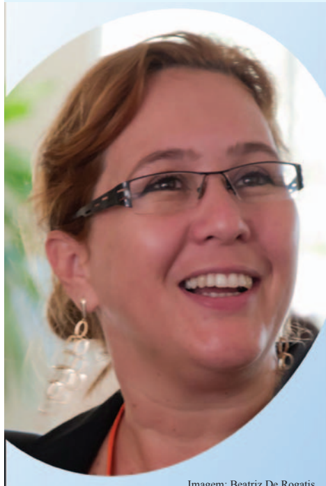
Imagem: Beatriz De Rogatis

Estamos prestes a dar mais um passo importante para contribuir com a melhoria da educação em nosso País: a entrega dos Planos Municipais e Estaduais de Educação, que deve ocorrer até o dia 24 de junho.